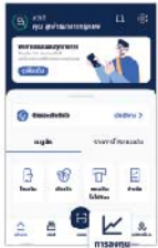
1. เลือกเมนู "การลงทุน"