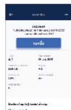
4. ตรวจสอบรายละเอียด แลกด "จองซื้อ" จากนั้นทำตามขั้นตอนหน้าจอจนเสร็จสิ้น กด "ยืนยัน"