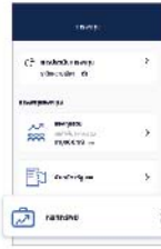
2. เลือก "หลักทรัพย์"