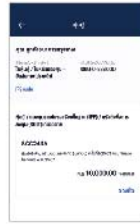
4. เมื่อสร้างโปรไฟล์สำเร็จ สามารถ "จองซื้อ" หลักทรัพย์ ที่อยู่ระหว่างเสนอขายได้ทันที

หมายเหตุ: สามารถดำเนินการสร้างโปรไฟล์ใช้ล่วงหน้าได้เลยตั้งแต่วันที่ (7.00 น. - 22.00 น.)