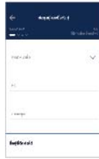
3. กรอกข้อมูลส่วนตัว และทำตามขั้นตอนหน้าจอ