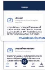
2. ที่หัวข้อ "หลักทรัพย์" เลือก "สร้างโปรไฟล์จองซื้อหลักทรัพย์"