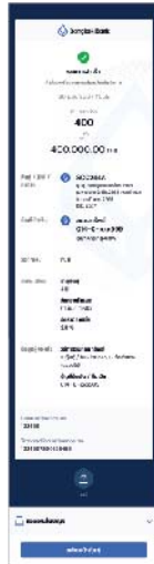
5. เมื่อทำการสำเร็จ คุณจะได้รับเป็นหลักฐาน