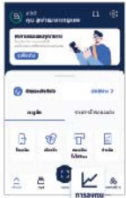
1. เลือกเมนู "การลงทุน"