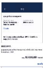
3. เลือกหลักทรัพย์ ที่ต้องการซื้อ แลกด "จองซื้อ"